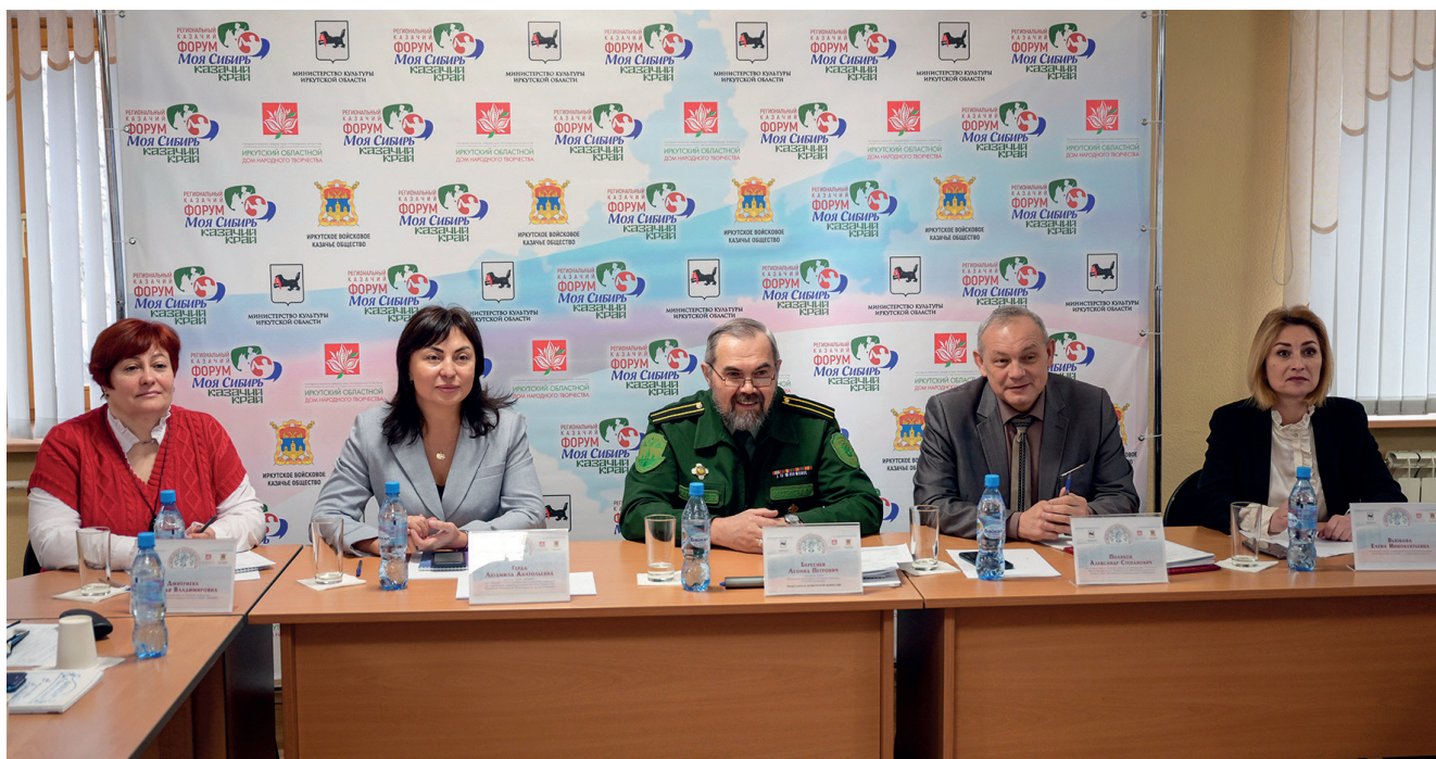
Региональный казачий форум «Моя Сибирь – казачий край».

Поддержка центров казачьей культуры со стороны Правительства Иркутской области и администраций муниципальных образований региона очень весома и значима. Дальнейшее расширение сети центров казачьей культуры будет способствовать решению нашей общей задачи – возрождению российского казачества.