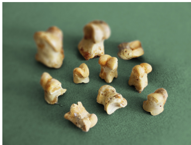
Свиные кости для игры «В бабки». Фотография Евгении Московских, г. Иркутск, 2023

Предметы: битки, говяжьи или свиные кости.