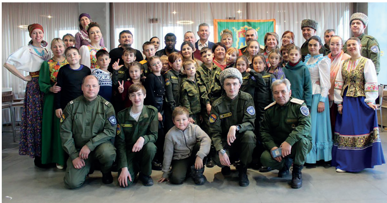
Участники проекта «Казачья кухня – как казачья песня» на празднике День матери-казачки. г. Иркутск, 2022

Государственная поддержка центров казачьей культуры и сохранение казачьего наследия являются важным шагом в развитии казачества как внутри страны, так и за её пределами. Ежедневно Совет при Президенте Российской Федерации по делам казачества и исполнительные органы государственной власти Иркутской области координируют создание новых и функционирование уже действующих центров, создают новые меры поддержки и не позволяют казачьей культуре забыться. Благодаря этим усилиям казачество продолжит жить и развиваться, а его история и культура будут передаваться поколениями.