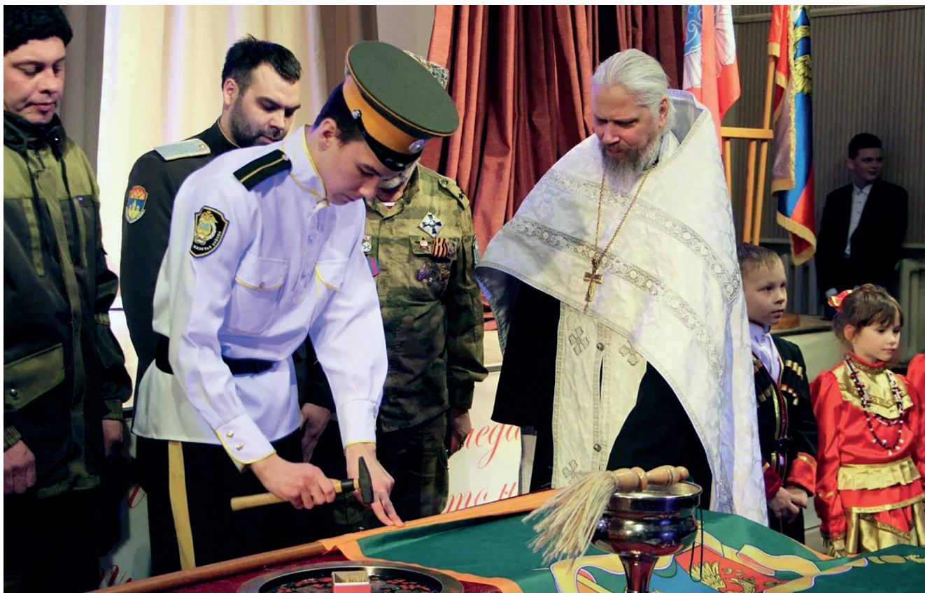
Освящение знамени, забивание знаменных гвоздей.