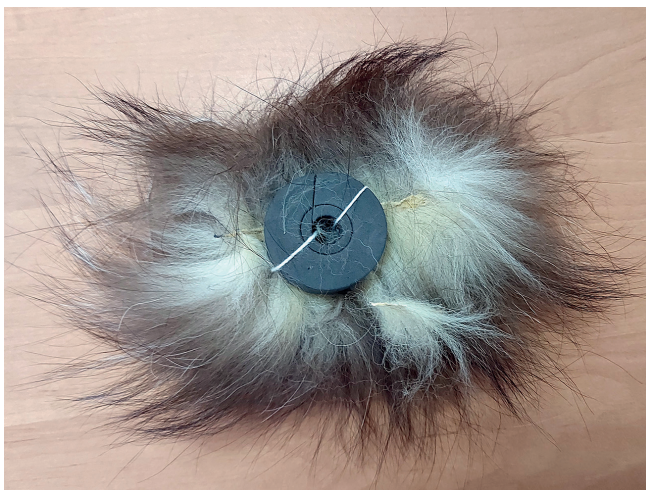
Зоска. Фотография Алексея Беляевского, ЦКК «Благовест», с. Казачье, 2023

частью стопы другой ноги, которую дети называют «бабочка», набивали как можно больше очков, подпывая зоску кверху, не давая ей упасть. На кон ставили физические упражнения, которые проигравшим игрокам раздавал победитель.