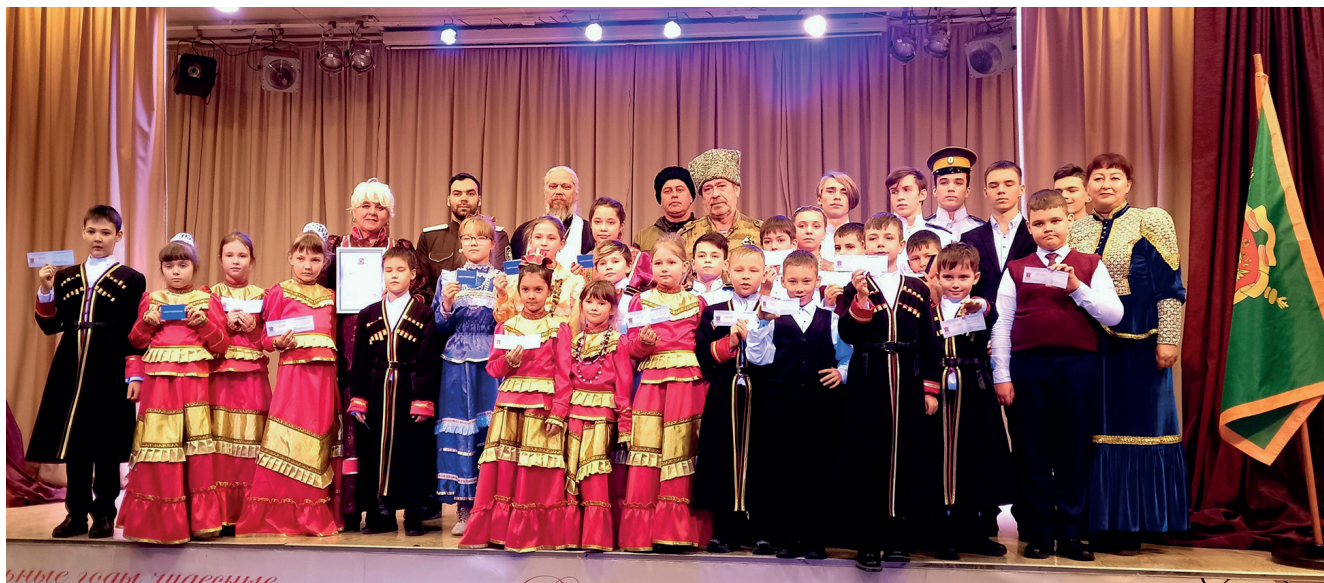
Мероприятие «На верность казачеству я принимаю присягу». Фотография Ирины Асташовой, г. Слюдянка, РЖД Лицей № 11