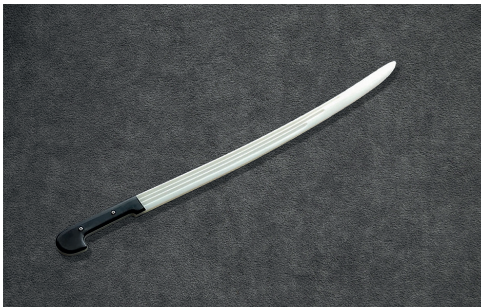
Нейлоновая шашка с белым клинком для занятий

В современном мире существует множество методик по фланкировке. Важно, чтобы занимаясь фланкировкой, наши дети учились любить Родину, становились сильными духом и чтит русские традиции. Настоящий казак определяет для себя эти цели в словах казачьей присяги: «Служу Отечеству, казачеству и вере православной!».