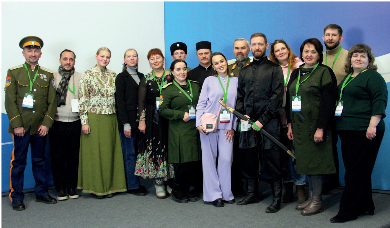
Участники и приглашенные специалисты Областного конкурса «Лучший центр казачьей культуры Иркутской области». Иркутск, 2023

традиционном костюме казачки, о песнях, которые пели казаки на нашей территории.