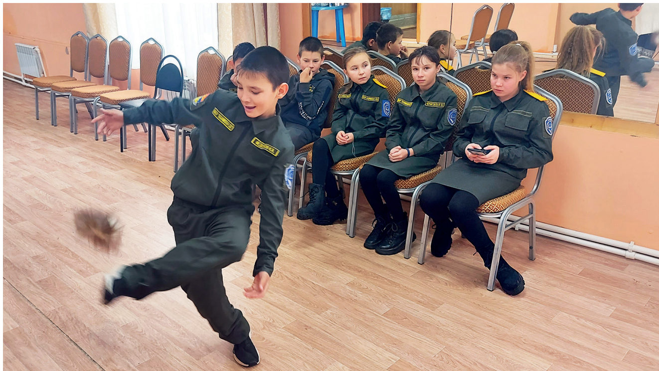
Игра «Зоска». Фотография Алексея Беляевского, ЦКК «Благовест», с. Казачье, 2023

Описание: стоя на одной ноге, внутренней