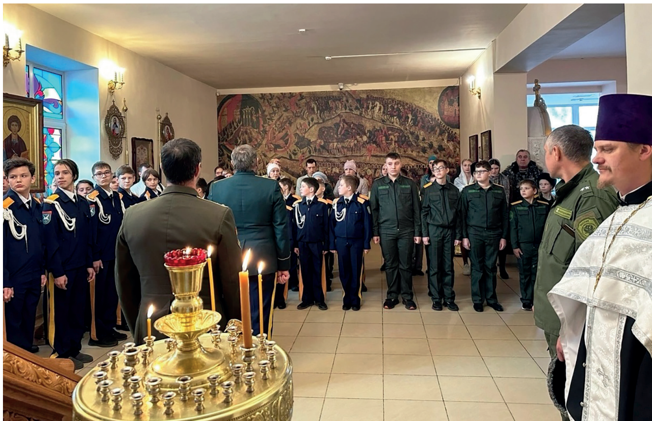
На присяге казачьего кадетского класса и казачьего клуба им. Максима Перфильева, г. Братск, 2023

главную роль в избрании нового царя сыграли донские казаки. Так, с помощью и при поддержке донцов на престол вступил Михаил Романов (к сведению: патриарх Ермоген был из донских казаков). Тем самым прошли годы Смуты, а главное, Русь сохранила православную веру, которая и была стержнем русского духа. Именно вера помогла в 1991 году возродить казачество. Казаки начинают объединяться в общественные организации. Иначе как чудом Божьего промысла назвать это нельзя.