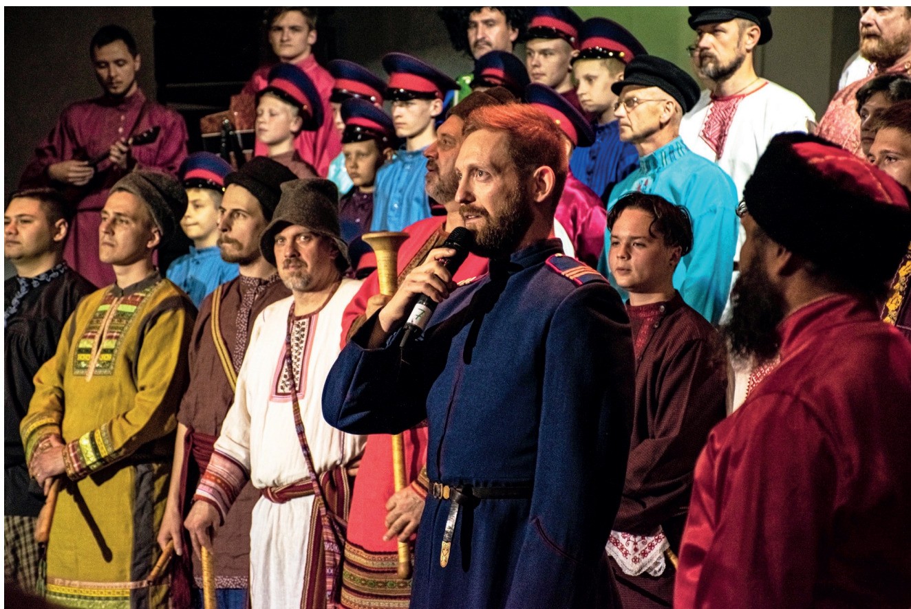
Участники Всероссийского мужского фестиваля «Братчина». Московский Государственный институт культуры, май 2023

тателя начнет формироваться понимание, что есть «сценическое» исполнение песни, а что «традиционное». Но всё же несколько слов напишу об этом, чтобы подытожить. Сценическое пение – это не содержание, а форма воплощения! В эту форму можно и нужно облачать «традиционное» пение, хоть это и непросто. Разумеется, речь идёт о «в высшей степени» качественном подходе. К сожалению, чаще бывает иначе.