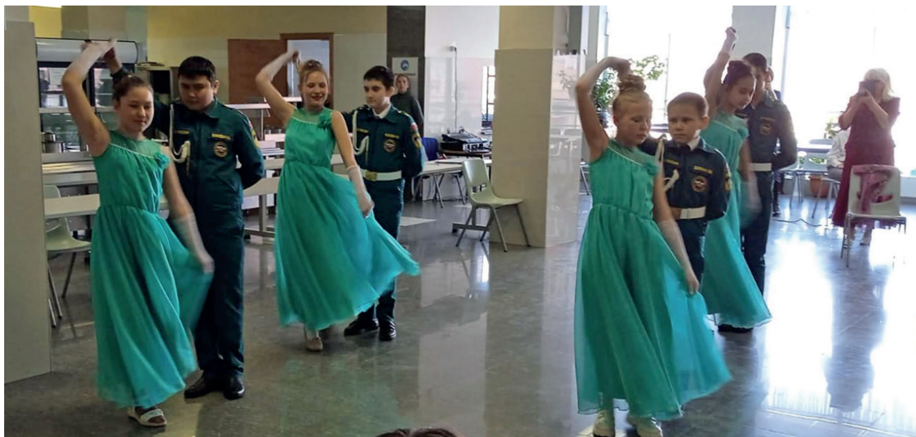
Исполнение вальса кадетами МЧС. п. Култук, школа № 7, 2023

вольствием подходили, рассматривали шашку. Мы пообещали ребятам, что такие встречи у нас продолжатся. Обязательно организуем обмен опытом, проведем совместно мастер-класс по фланкировке. В планах Центра казачьей культуры на 2024 год создание кадетского казачьего класса на базе школы № 1.