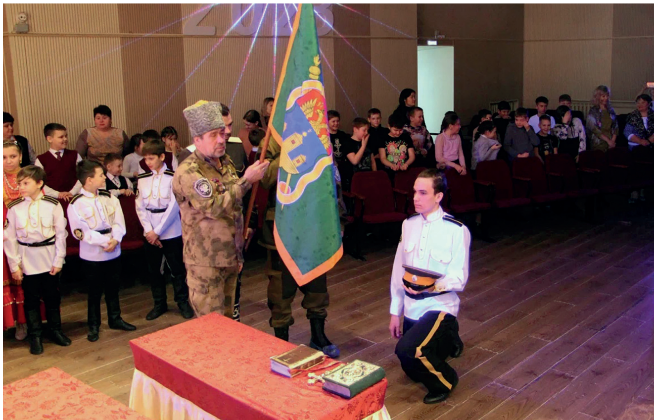
Старшина передает знамя юному знаменосцу. Фотография Ирины Асташовой, г. Слюдянка, 2023

когда они станут образом жизни и будут передаваться из поколения в поколение.