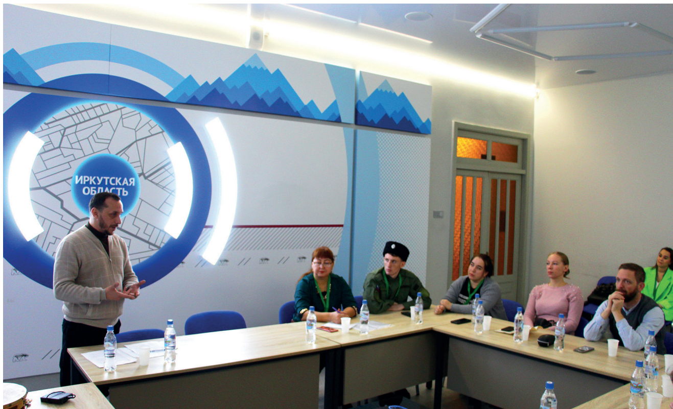
Участники и спикеры Регионального казачьего форума «Моя Сибирь – казачий край». Иркутск, 2023

1) Отсутствие сценического костюма, характерного для Иркутской области.